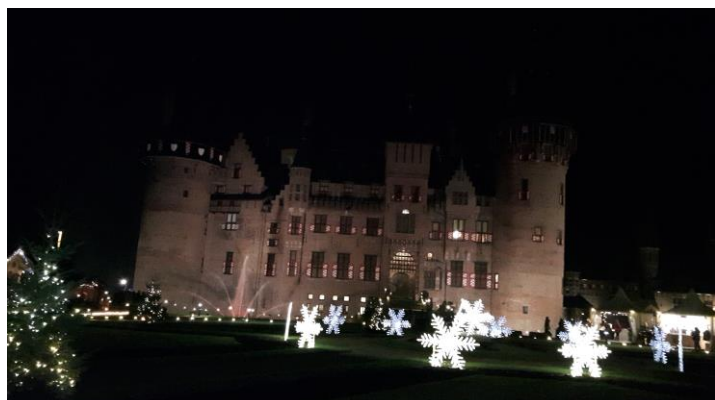
Country en Christmas Fair bij Kasteel de Haar

Het jaar 2016 loopt alweer teneinde de laatste les zit er alweer op.