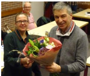
Bloemen voor de jubilarissen